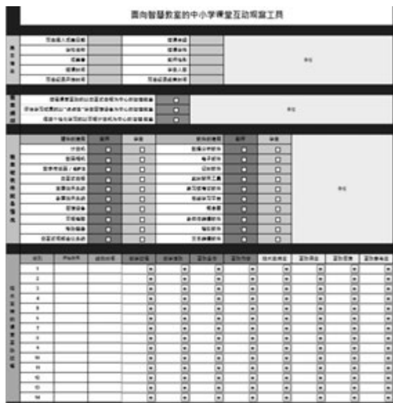
图3 面向智慧教室的课堂互动观察工具的部分界面

课堂观察涉及面较广,观察者匆忙中纪录数据,可能会造成信息的漏记和误记等现象。借助信息技术将课堂观察工具变成计算机程序,观察者只需点击鼠标记录要点,可很大程度上减轻观察者的负担,提高互动观察纪录的准确性。本研究参考ICOT工具的技术路线,将面向智慧教室的中小学课堂互动观测纪录过程程序化。工具的部分界面如图3所示。