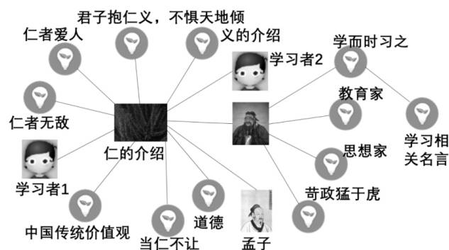
图3 群体知识图谱活动

免存在知识遗漏的现象。因此,群体知识图谱可以在一定程度上弥补个体的知识遗漏,从而促进知识图谱的完善,是群体智慧促进本体构建和进化的重要方式。图3为群体知识图谱。