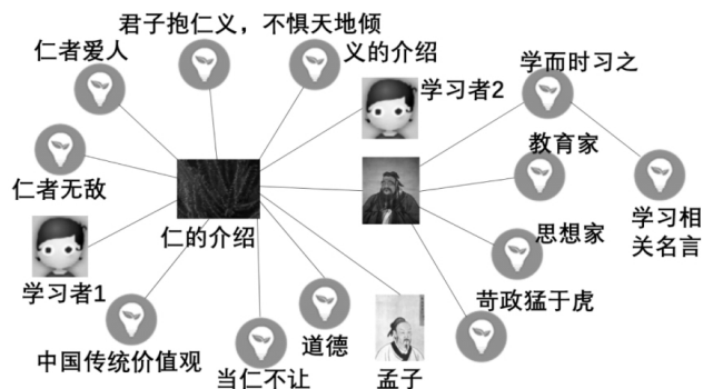
图3 群体知识图谱活动

免存在知识遗漏的现象。因此,群体知识图谱可以在一定程度上弥补个体的知识遗漏,从而促进知识图谱的完善,是群体智慧促进本体构建和进化的重要方式。图3为群体知识图谱。