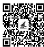
图2 “教育新技术”公众号二维码及英语单词识别图 Android用户扫描二维码关注“教育新技术”公众号,回复“AR语言”,下载apk,安装后打开软件扫描图2“Dog”或“Cat”

“快乐记单词”英语学习系统基于Java语言、Android SDK、Wikitude SDK设计开发。打开应用程序,点击“开始取词”按钮,系统将调用摄像头,并识别卡片中的英文单词。若取词成功,屏幕会显示对应物品的三维动画,点击动画会显示中文释义和单词发音;若取词失败,则屏幕没有反应,点击“返回”按钮即可返回开始界面。