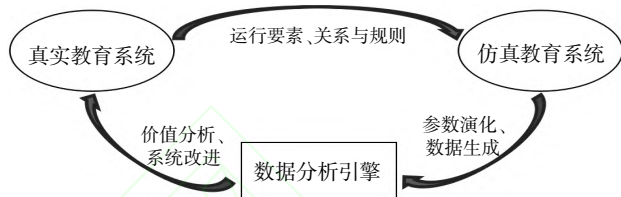
图1 数据驱动的教育计算实验研究各要素间的关系

基于大数据的教育计算实验研究是数据驱动的实验研究,将现实中教育系统的各要素及其关系映射到仿真模型,将研究问题所涉及的显变量、潜变量及其相互作用关系一一表达出来,建立基于计算机的人工仿真教育系统,这个系统是真实教育系统的镜像。因此,可以将数据驱动的教育实验表示为:数据驱动的教育实验=真实教育系统+仿真教育系统+数据分析引擎,它们之间的关系如图1所示。