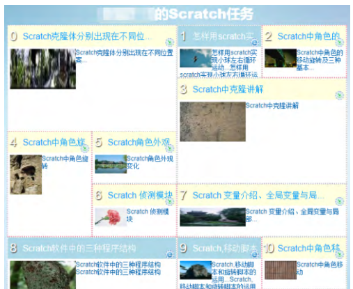
图 3 某小组创建的策展集作品