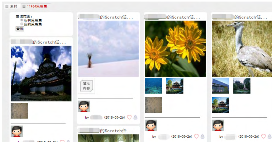
图 4 分享至策展广场

课后，各小组依据教师和同伴的建议修改、完善本组的策展集作品，之后将其分享至策展广场（如图 4 所示）和学习社区，供小组之间相互查看和学习。课程结束前，每位学生都要撰写课程的反思笔记，内容包括遇到了哪些问题、如何解决这些问题的、有什么收获和思考等。