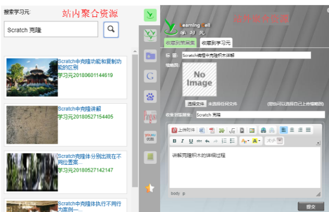
图 2 利用策展工具进行站内外素材聚合